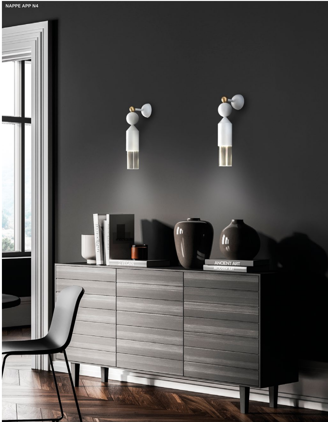
NAPPE APP N4